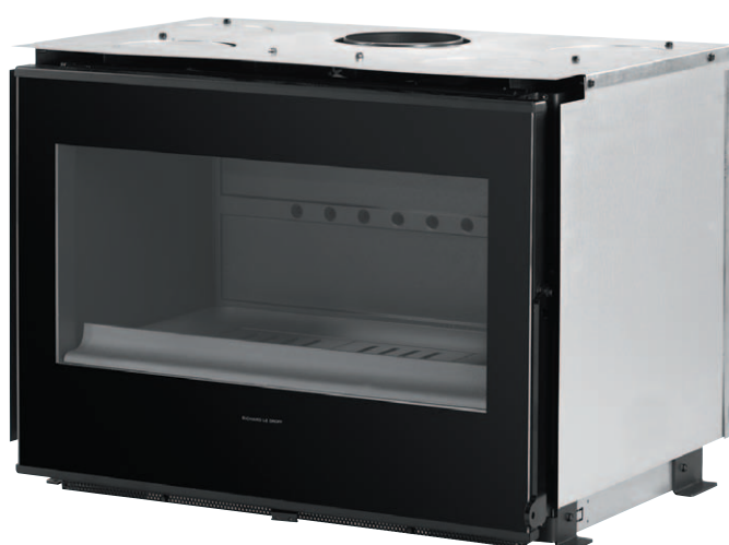
800 HORIZON FV