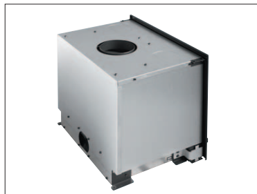
Carénage complet (monté de série)