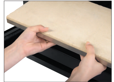
Défecteur inox doublé vermiculite amovible sans outil