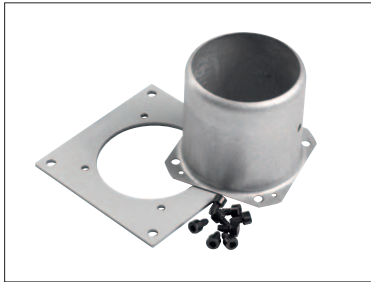
Buse de raccordement d'air Ø 75 mm