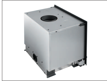
Carénage complet (monté de série)