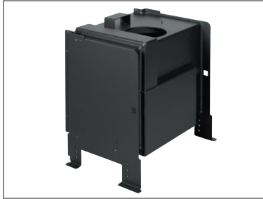
Corps de chauffe sans carénage